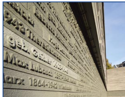
Stadtarchiv Wiesbaden Foto: Jörg Siebold

Das sam hat 2019 zusammen mit Jugendlichen eine Führung zum Thema Judenverfolgung in Wiesbaden zur Zeit des Nationalsozialismus entwickelt. Jugendliche haben ganz eigene Fragen, wenn sie sich mit unserer Stadt in der NS-Zeit beschäftigen. Die Schüler*innen haben selbst ausgearbeitet, welche Orte besucht werden. Dadurch werden neben den bekannten Mahnmalen auch eher unbekanntes Einzel- und Familienschicksale behandelt. Diese Arbeit und Themenstellung der jungen Menschen würdigen wir, indem wir diese Führung nun neben Schulen auch der Öffentlichkeit anbieten.