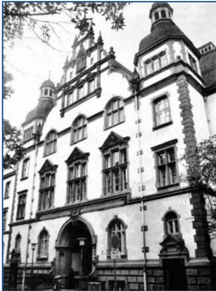
Ehemaliges Amts- und Landgericht Wiesbaden

Eine Veranstaltung des frauen museums wiesbaden in Kooperation mit dem Verein für Nassauische Altertumskunde und Geschichtsforschung e.V.