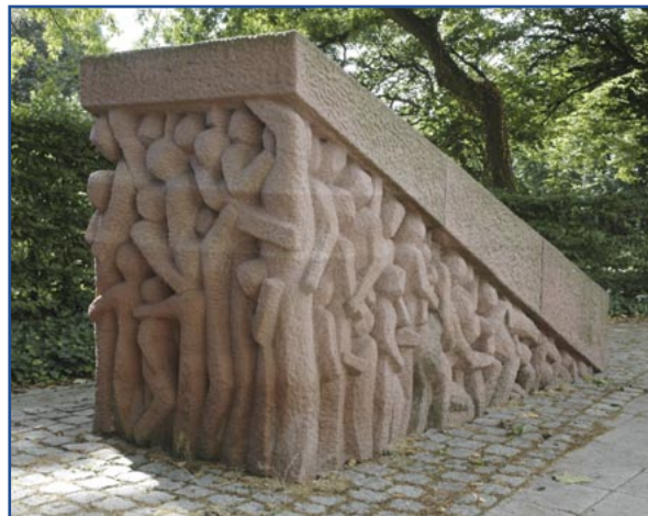
Das Mahnmal für die in der NS-Zeit deportierten und ermordeten Wiesbadener Sinti und Roma.