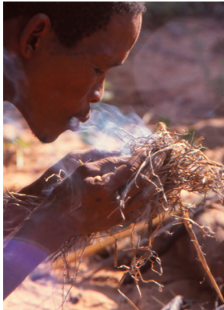
San beim Feuermachen. Foto: Werner Hammer, 2007

Anmeldung für Privatgruppen: Fon 0611/335 2240 oder fuehrungen@museum-wiesbaden.de