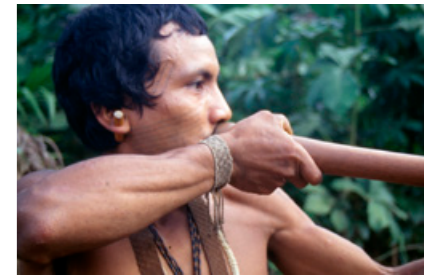
Matis beim Jagen mit dem Blasrohr. Foto: Werner Hammer, 1993