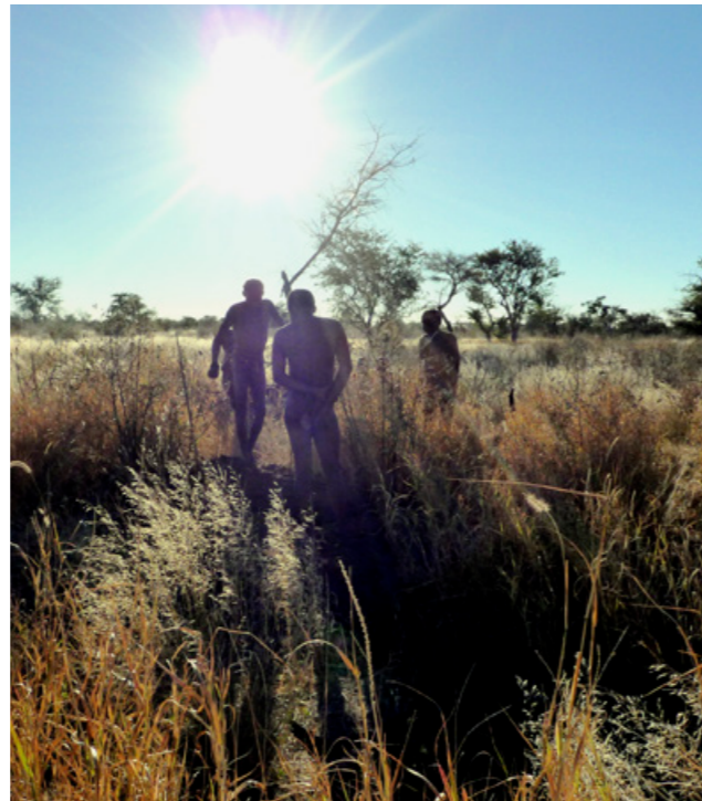
Rechts: San beim Jagen. Foto: David Barrie, 2008, CC BY-2.0

Oben: Gesammelte Nahrung. Foto: Museum Wiesbaden, 2015