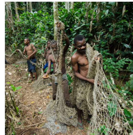
Pygmäen bei der Netzjagd. Foto: Pete Oxford, 2013

Lokale Gemeinschaften von Jägern und Sammlern leben heute meist nur noch in extra für sie geschaffenen Reservaten oder in Gebieten, die bis jetzt aus ökonomischer Sicht für die Welt uninteressant waren. Die dort lebenden Menschen sollten selber entscheiden können, ob sie weiterhin isoliert ihre Kultur pflegen oder mit der Außenwelt Kontakt haben möchten.