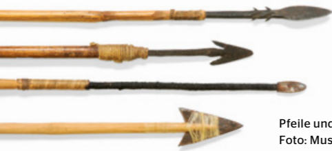
Pfeile und Speere.

Mit Pfeil und Korb durch die ganze Welt! Mit zahlreichen Hands-on-Objekten wird anschaulich vorgestellt, wie sich Jäger und Sammler-Kulturen den jeweiligen Umweltbedingungen anpassen und ihr Leben bestreiten. Dabei können sich die Teilnehmer ein Bild der unterschiedlichen Völker machen. Zusätzlich zu den interaktiven Führungen werden Workshops angeboten. Weitere Informationen: www.museum-wiesbaden.de/edu